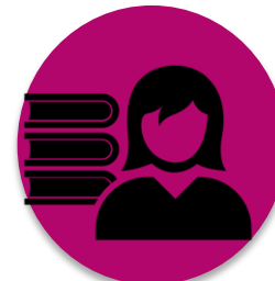
Centre de documentation